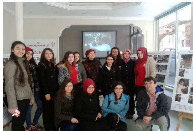
Öğretmen ve öğrencilerimiz "Soma'da Çocuk Olmak"ın Soma'daki ikinci Sergisinde...