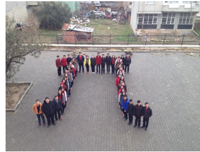
Bu yazı için \pi olan, 10-C ve 9-B sınıflarına \pi nin devredeni kadar teşekkürler...

İnsanoğlu, daire dediğimiz düzgün yuvarlak şeklin farkına tekerleğin icadından çok önceki tarihlerde varmıştır. Daha sonraları elindeki sopa ile kum gibi düzgün yüzeylere daireler çizdi. Sezgiledi ki dairenin bir kenarından diğer kenarına olan uzaklık (çap) büyüdükçe daire de büyüyor. Cilalı taş dönemi insanı bu durumu soyutlayarak gördü ki dairenin çevresi ile çapı orantılı. Daire büyüyüp küçülse de oran değişmiyordu. Bu sabit yunan alfabesinin on altıncı harfi olan \pi sembolüdür. Bu sembol yunanca çevre, çember anlamına gelen perimetier kelimesinin ilk harfidir. Euler'den önceki p harfini kullanıyorlardı. Euler, 1737 yılında yayımladığı analiz adlı eserinde \pi sembolünü kullandı. Daha sonra bu sembol tüm matematikçiler tarafından kullanılmaya başlandı.